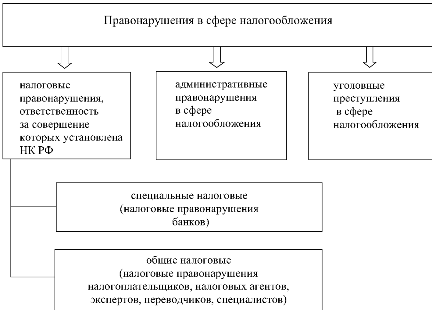
Рисунок 2. - Правонарушения в сфере налогообложения

Ответственность за совершение налоговых правонарушений несут организации и физические лица в случаях, предусмотренных НК РФ. Физическое лицо может быть привлечено к налоговой ответственности с шестнадцатилетнего возраста.